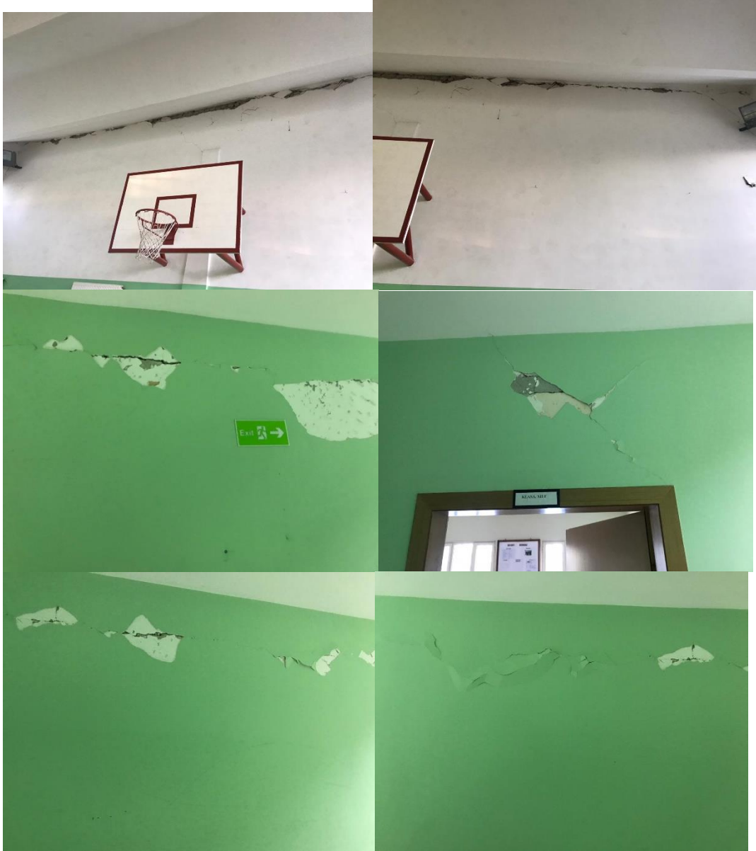
Milot High School:

This project is funded by the European Union