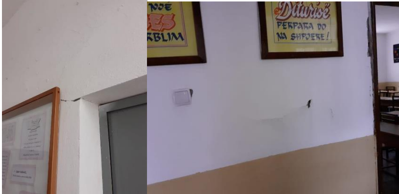
“At Shtjefën Kurti” High School:

This project is funded by the European Union