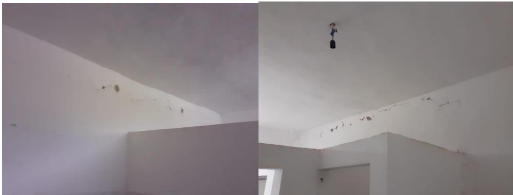
“Kolin Gjoka” Vocational High School